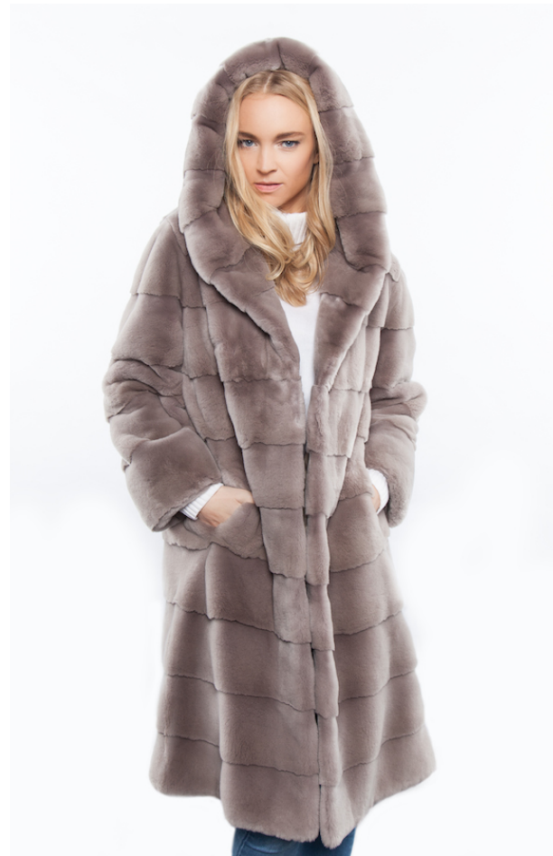
Federleichter Samt Nerz Mantel